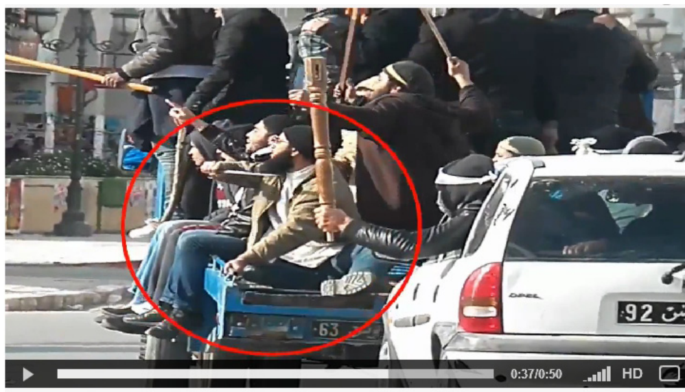
Islamisten fahren durch Sfax und drohen mit Dolch und Knüppeln

Arbeit, Wohnung, Auskommen und gleiche Rechte für alle!